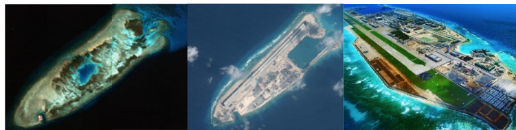
فایری ریف به ترتیب از چپ در سال‌های ۲۰۱۴ و ۲۰۱۵ و ۲۰۱۷

نهایتاً دادگاه داوری، فایری کراس و همچنین اسکاربورگ شول را مشمول بند سوم ماده ۱۲۱ ندانست و بدین‌سان، هیچ‌یک از موارد مورد اختلاف فیلیپین و چین را نه جزیره صخره‌ای، بلکه همه را صخره شمرد. ۲