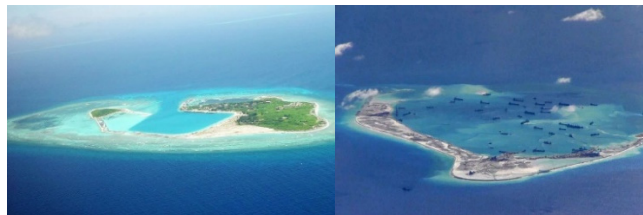
اسکاربورگ شول قبل و بعد از بازسازی توسط چین به ترتیب از چپ در سال‌های ۲۰۱۵ و ۲۰۱۶