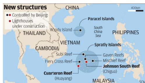
موقعیت تمامی صخره‌ها و جزایر بهینه آبی دریای چین جنوبی